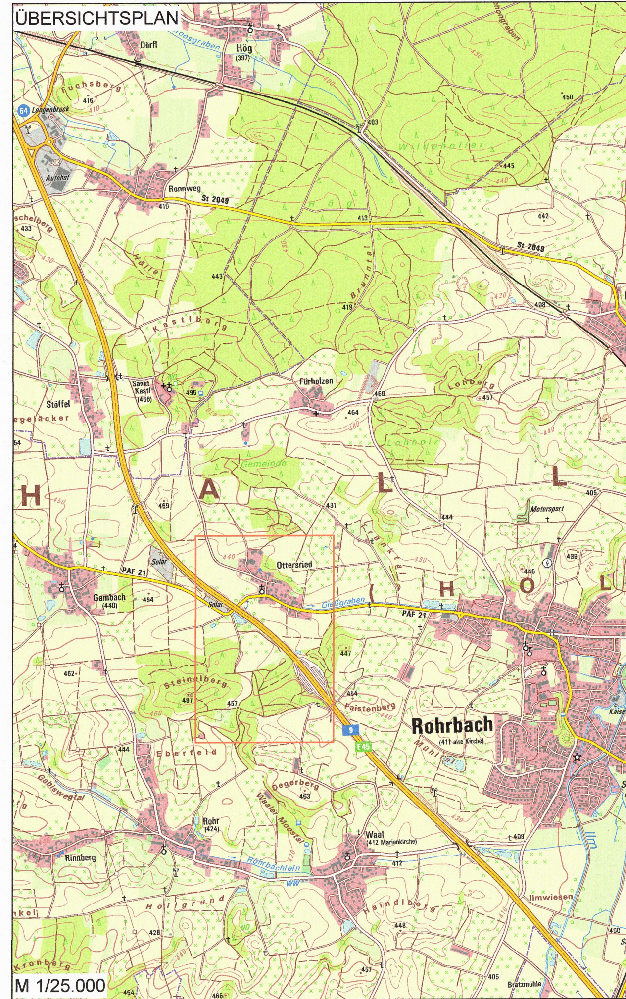
Topografische Karte