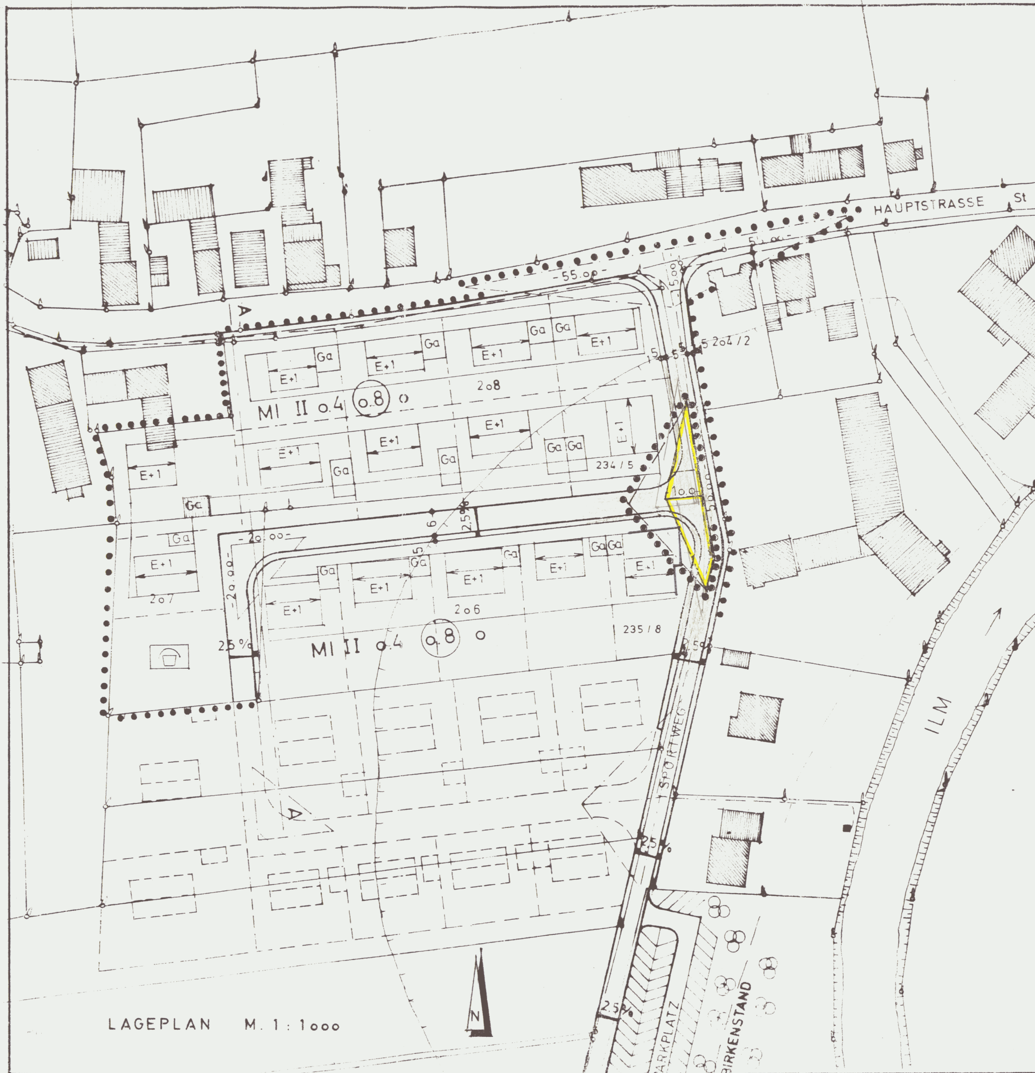
LAGEPLAN M. 1 : 1000

Dipl.-Ing. Georg Fuchs Regierungsbaumeister 8069 Wolnzach - Burgstall Hausnerstr. 21, Tel. 08442/8219